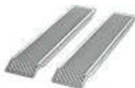
505 69 90-40 Lastramper

Lastramper av havsvattentålig aluminium med den välkända halkskyddsytan O3, som ger alla slags hjul ett gott grepp även i våta och hala miljöer. Lastramperna passar väl för användning på släpkärror med en maximal höjd om 700 mm och för en total belastning om 450 kg per par. Ramperna säljs i par. Dimensioner: 200x1500x35 mm.