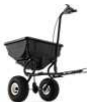
954 12 00-46 Spridare 30

Spridare med enkel justering av flöde, för mindre områden. Kan användas för spridning av konstgödning och gräsfrö i din trädgård, liksom för granulat till snösmältning. Om spridaren används med salt måste den rengöras väl efter användandet för att förhindra korrosion.