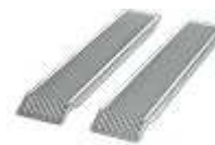
505 69 90-40 Lastramper

Heltäckande kapell för riders. Tillverkat i vattenavvisande nylon. Justerbart längst ner samt med ventilationshål.