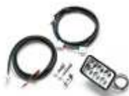
581 12 54-01 Belysningskit

Spridare med enkel justering av flöde, för mindre områden. Kan användas för spridning av konstgödning och gräsfrö i din trädgård, liksom för granulat till snösmältning. Om spridaren används med salt måste den rengöras väl efter användandet för att förhindra korrosion.