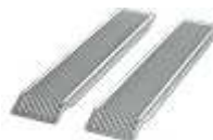
505 69 90-42 Lastramper

Lastramper av havsvattentålig aluminium med den välkända halkskyddsytan O3, som ger alla slags hjul ett gott grepp även i våta och hala miljöer. Lastramperna passar väl för användning på släpkärror med en maximal höjd om 700 mm och för en total belastning om 450 kg per par. Ramperna säljs i par. Dimensioner: 200x1500x35 mm.