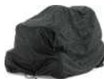
505 63 08-70 Kapell

LED-belysningskit för att göra arbetet lättare när det är mörkt ute, bred ljusfördelning och låg strömförbrukning. 30 000 timmars livslängd vid normal användning. Passar alla Frontriders.